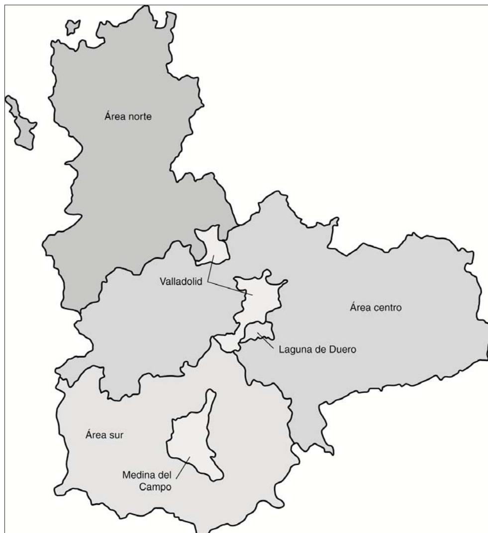
Figura 1. División de la provincia de Valladolid en las 6 áreas del estudio.

La DDD es una unidad de medida para cuantificar el consumo de medicamentos recomendada por la Organización Mundial de la Salud (OMS) para su empleo en la realización de los estudios de utilización de